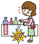
買い物中過ぎて商品を壊した